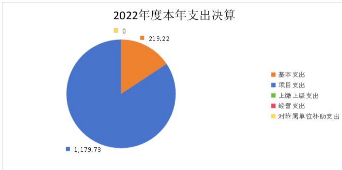
图 2. 支出决算图